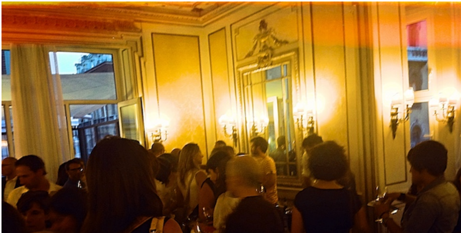
GSTW Genova 2015

info@godsavethewine.com - riceverete conferma scritta