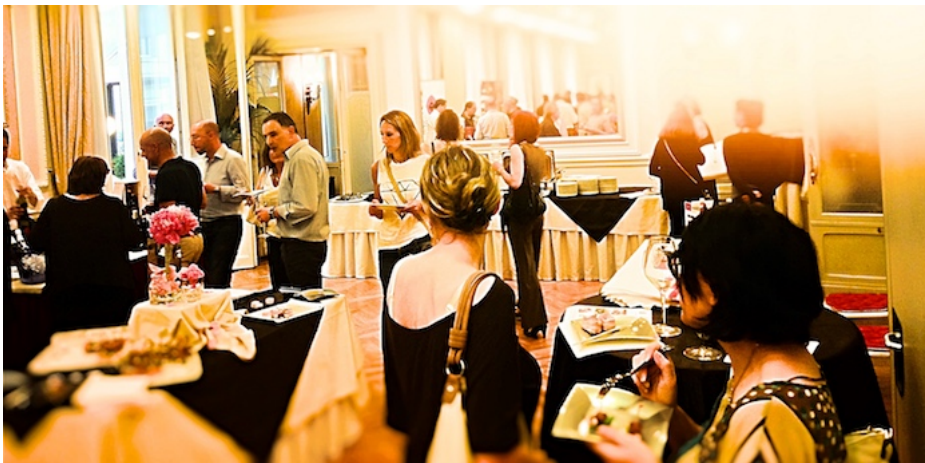
GSTW Genova 2015 buffet