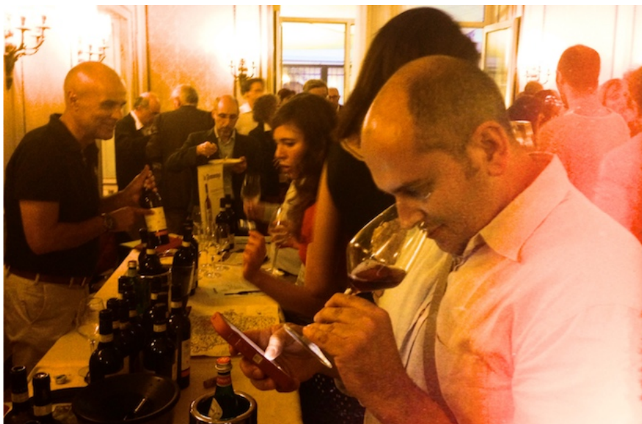
Gori a Genova 2015

Appuntamento a Genova, sulle altezze inebrianti delle terrazze del Bristol Palace, per abbracciare il porto e il mare in una serata che evoca i successi internazionali del vino italiano, i suoi viaggi, la sua continua ripartenza... venerdì 23 giugno.