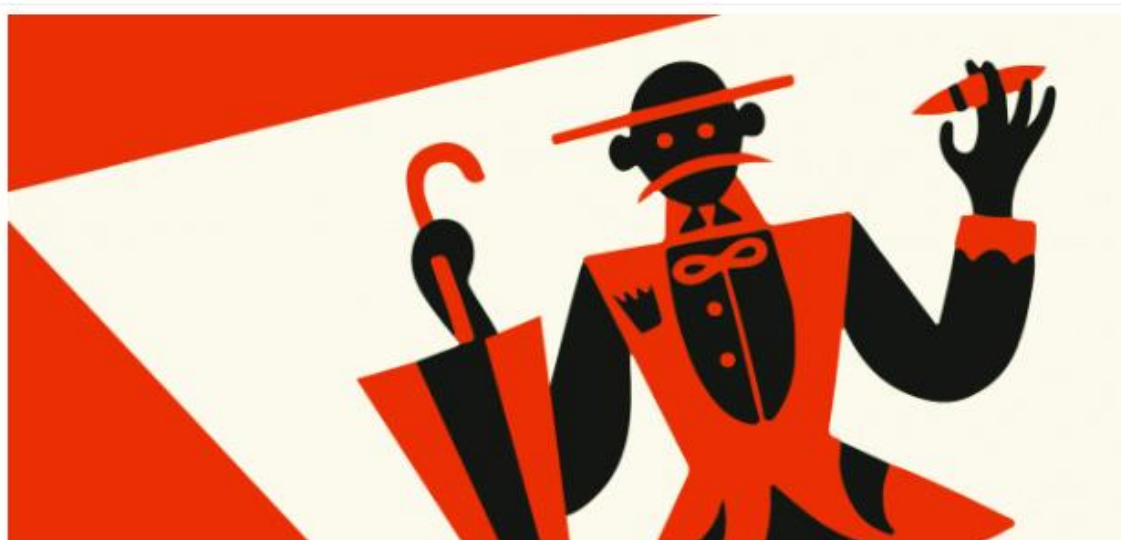
Fortunato Depero il Mago

Grande attenzione per la mostra dedicata a Modigliani, in programma al Palazzo Ducale di Genova dal 16 marzo al 16 luglio. La mostra, allestita nell'appartamento del Doge di Palazzo Ducale, si propone di illustrare il percorso creativo di Amedeo Modigliani affrontando le principali componenti della sua carriera. Attraverso una trentina di dipinti provenienti da importanti musei e da prestigiose collezioni europee e americane, oltre ad altrettanti disegni, si intende mettere in risalto il grande valore della sua ricerca in quel clima assolutamente unico creatosi nella Parigi d'inizio Novecento. Modigliani testimonia infatti l'effervescenza dell'ambiente artistico e culturale di quegli anni, dove convivono e si incontrano grandi mecenati e mercanti accanto a scrittori e ad artisti protagonisti di un'irripetibile stagione di rinnovamento della pittura. Oltre ai ritratti la mostra rivolge un'attenzione particolare anche ai celebri nudi e ai disegni. Dove dormire a Genova: Hotel Bristol Palace Nel cuore del Liberty di Genova, in via XX Settembre, si trova questa elegante struttura Liberty nel centro della città. Presenta originali arredi Déco, preziosi oggetti e complementi d'arredo dell'Ottocento.