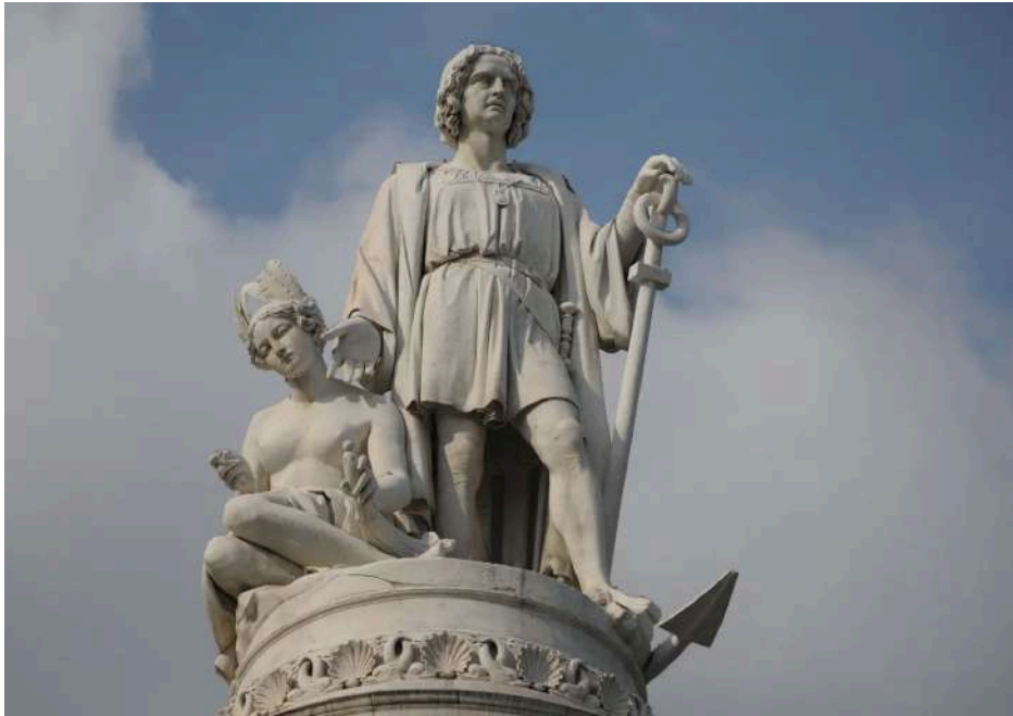
Grosser Entdecker und Seefahrer in Genueser Diensten: Kolumbus-Denkmal auf der Piazza Acquaverde.