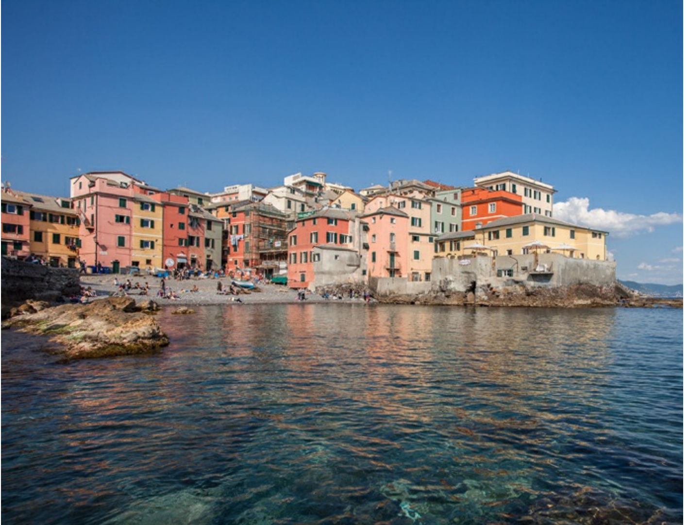
Генуя за 3 дні: нові маршрути редакції JetSetter.ua