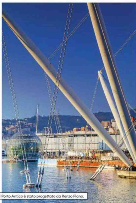
Il Bigo al Porto Antico è stato progettato da Renzo Piano.

L'albergo storico che ha incantato Hitchcock Si trova proprio in pieno centro, a pochi passi dal Palazzo Ducale e dal Teatro Carlo Felice e anche se il suo ingresso si fa notare poco, come tante bellezze nascoste della città, racchiude un tesoro. L'Hotel Bristol Palace, locale storico d'Italia, inaugurato nei primi del '900, restaurato nel 2014, è uno dei