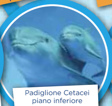
Padiglione Cetacei piano inferiore Nursery tutti i giorni h. 11:30