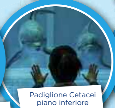
Padiglione Cetacei piano inferiore Main pool tutti i giorni h. 14:15