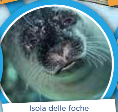
Isola delle foche piano 2 tutti i giorni h. 15:00