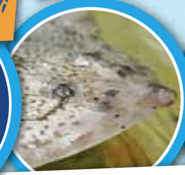
Padiglione Biodiversità martedì/giovedì/sabato h. 14:45

compresi nel prezzo del biglietto per scoprire tutti i segreti e le curiosità degli animali. Per i dettagli: www.acquariodigenova.it