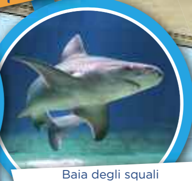
Baia degli squali mercoledì/venerdì/domenica h. 14:45

IMPORTANTE Durante la visita segui le frecce che indicano il percorso